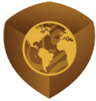
Rowad Translation Center